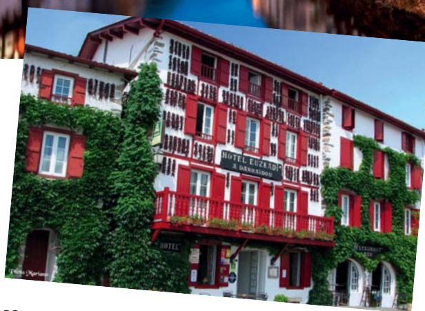
Saint-Jean-Pied-de-Port et Espelette

Inscription à la CMCAS avant le 30 août 2019.