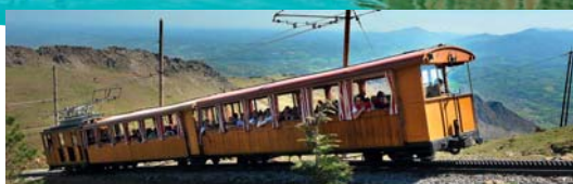
Saint-Jean-de-Luz et le train de la Rhune